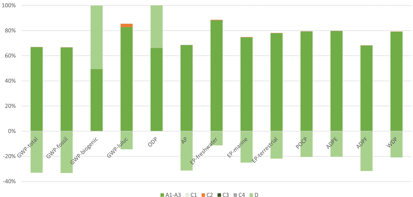
Relative Beiträge der verschiedenen Lebenszyklusphasen von Blechkonstruktionen

Stellt man die Umweltauswirkungen in den einzelnen Phasen im Lebenszyklus der Produkte gegenüber, so ergibt sich eine klare Dominanz der Produktionsphase (Module A1–A3; von der Wiege bis zum Werkstor). Dies betrifft Auswirkungen auf die Umwelt, die sich von der Wiege der Rohstoffe (bspw. Erzabbau) bis zum Unger-Werkstor ergeben. Die Umweltwirkung in der Produktionsphase ist hauptsächlich vom zugekauften Stahlvormaterial, also der Stahlproduktion bei Lieferanten von Unger, dominiert.